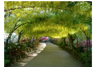
Bwa'r Tresi Aur, Gerddi Bodnant

I'r rheiny sydd wrth eu boddau yn garddio a chyda bywyd gwyllt, ewch i archwilio'r ardd blodau gwyllt yn Nhŷ Hyll gaiff ei chynnal a'i chadw gan Gymdeithas Eryri, gerddi'r Ymddiriedolaeth Genedlaethol ym Modnant a gerddi Castell Gwydyr . Mae nifer o safleoedd o ddiddordeb hanesyddol yn lleol gan gynnwys pentref chwarel diffaith Rhiwddolion, Tŷ Mawr Wybrnant - cartref cyfieithiad cyntaf y Beibl Cymraeg a safleoedd trefnadaeth ddiwydiannol hen chwarel Coedwig Gwydyr.