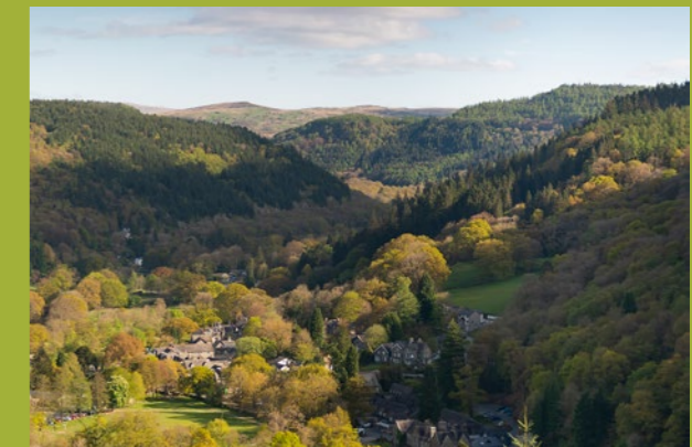
Cyhoeddwyd gan: Cymdeithas Dwristiaeth Betws-y-Coed a'r Ardal

Tra bod pob ymdrech wedi'i wneud i sicrhau cywirdeb yn y cyhoeddiad hwn, ni all y Gymdeithas na'i hysbysebwrwyr gymryd cyfrifoldeb am unrhyw gamgymeriad, anghywirdeb neu hepgoriad neu am unrhyw fater sy'n gysylltiedig mewn unrhyw ffordd gyda neu yn deillio o gyhoeddi'r wybodaeth ynghlwm.