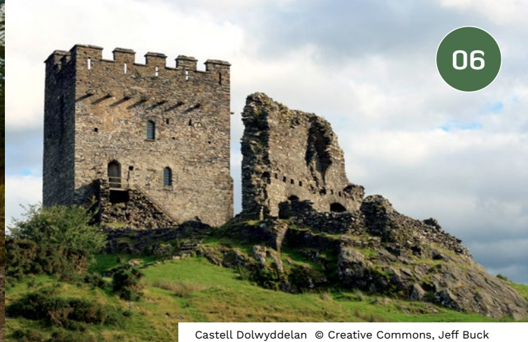
Castell Dolwyddelan

Cyfeirnod Map: SH 79124 56782 Lledred: 53.094379 Hydred: -3.8063231